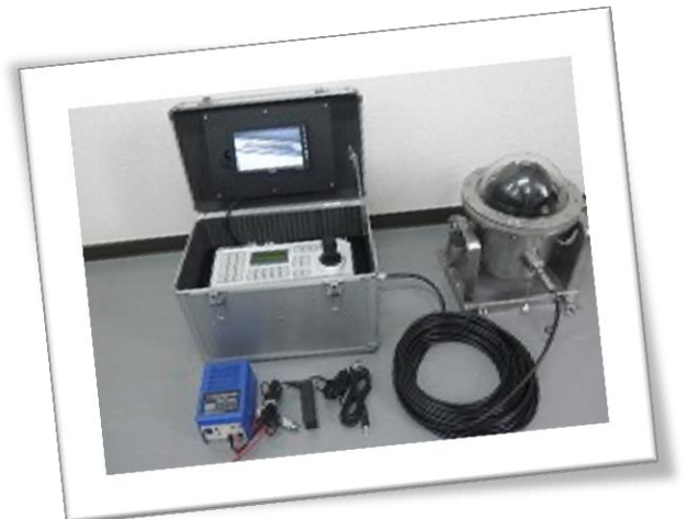
手元の操作は 便利なジョイスティック付きコントローラーで