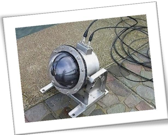
監視カメラはステンレスカバーと アクリルドームでガードされています。