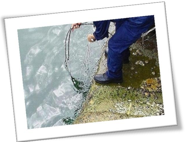
水中へのカメラ設置の様子